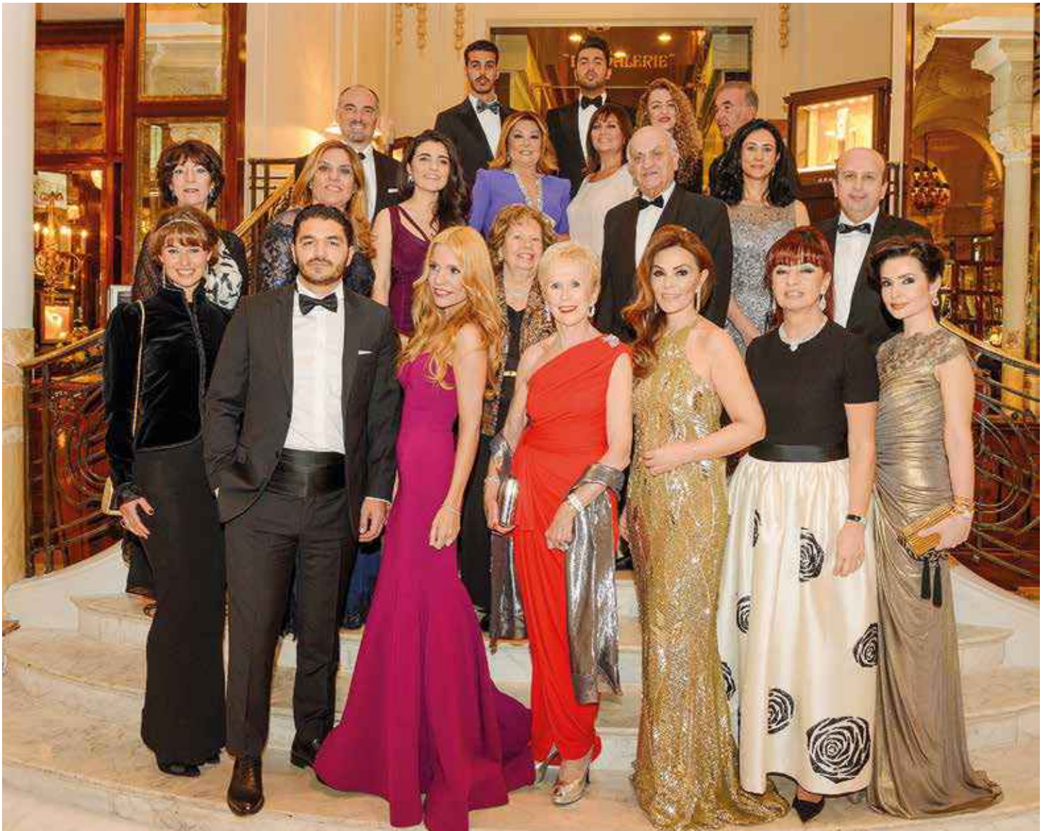
The 2014 edition of the Rose Ball honoured Turkey and a host of VIP guests. | L'édition 2014 du Bal de la Rose a fait honneur à la Turquie et à un parterre de prestigieux invités.