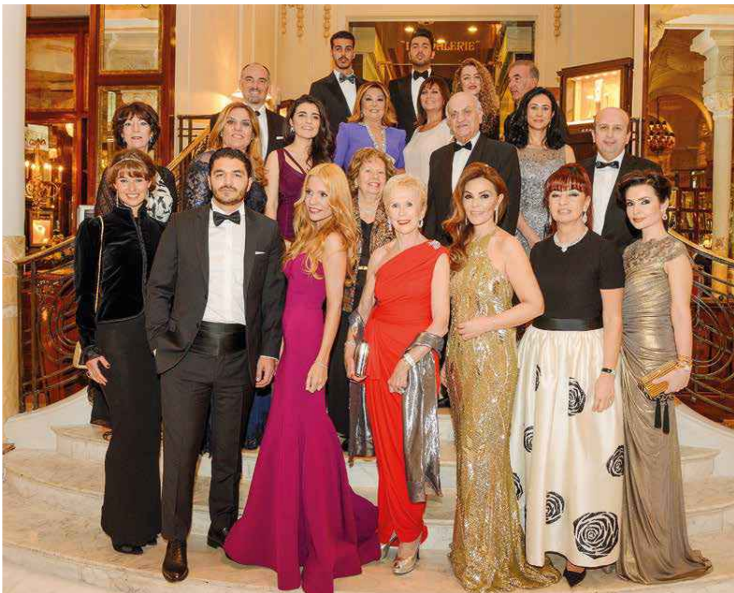
The 2014 edition of the Rose Ball honoured Turkey and a host of VIP guests. | L'édition 2014 du Bal de la Rose a fait honneur à la Turquie et à un parterre de prestigieux invités.