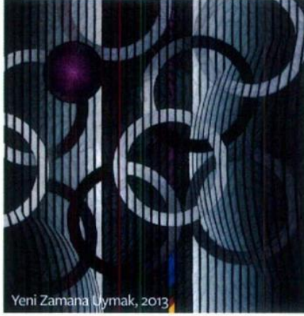
Yeni Zamana Uymak, 2013

sonraki işlerim tamamen kimlik üzerine olacak değil. Örneğin pizza ile ilgili bir iş yaptım. Ama kendi açımdan baktığımda da daha çok özgürleştirmeyi düşünüyorum. Belki bir beş on sene önce bu işleri yapamazdık. Dünya değişiyor, Türkiye de buna uymak zorunda; bu anlamda sanatçılar da görevlerini yaptılar. Bence şu anda bu ülke sanatta en iyi dönemini yaşıyor, ama yine de yeterli değil.